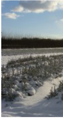
Det er flot i landskabet med nyfalden sne og solskin.