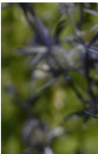
Alpe-mandstro er en usædvanlig plante, der altid vækker opsigt.

Som et højdepunkt i bedet er plantet en eller flere silkekatost, Sicalcea Ælsie Heugh - der med sine sartrosa farver lige giver de blå og rødlige farver lidt luftig lethed.