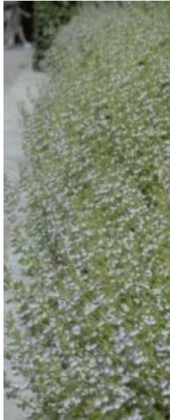
Hedebjergmynte begynder med hvide blomster, der bliver mere og mere blå i løbet af efteråret.